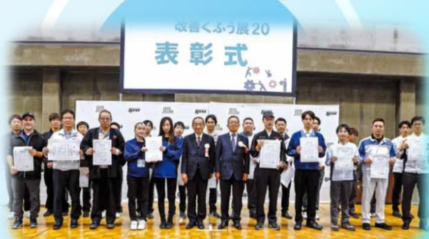
▲ 昨年度の受賞企業の皆さま