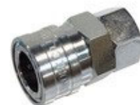
エアーロイメージ 日東工器：サイズ13mm

隣接する他社ブースのフックの先が 自社ブースにかかる場合があります あらかじめご了承ください